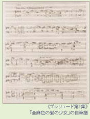
『プレリュード第1集』 『亜麻色の髪の乙女』の自筆譜