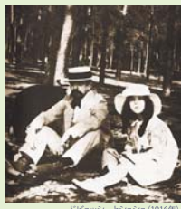
ドビュッシーとジュシュ(1916年)