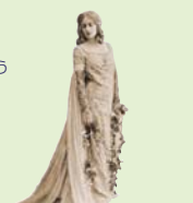
メリザンド役のメアリー・ガーデン