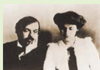
ドビュッシーとリリー(1902年)