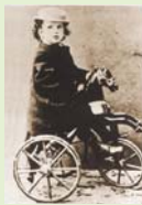
ドビュッシーの幼少時の写真